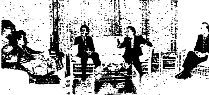
الرئيس الجميل مجتمعاً بالقليبي والوفد المرافق له